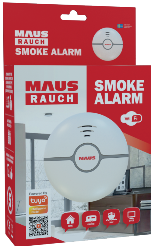
MAUS Rauch Wifi Box